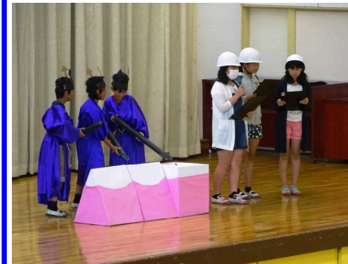
保健委員会の集会

2学期の始業式に、学校ではできない体験活動に取り組み、成長した子供たちの姿を見ることを楽しみにしています。