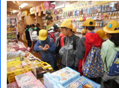
グループ行動ではお店に立ち寄り買い物もしました。

10月13、14日に6年生が鎌倉と横浜に修学旅行に行ってきました。鎌倉では協力してグループ行動、横浜では中華街で食事、ホテルではテーブルマナー体験など、1泊2日の中で多くの貴重な体験をすることができました。卒業に向けて良い思い出ができましたね。