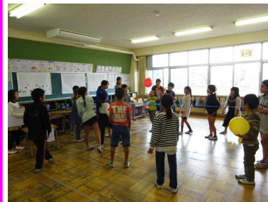
それぞれのお店では子どもたちの元気な声でいっぱいでした。

10月22日にドリーム集会が行われました。ドリーム集会では縦割り班ごとに工夫して、各教室で楽しいお店を開きました。どこのお店もたくさんのお客さんと賑わいました。桜っ子まつりは、大勢のPTAのボランティアの皆様にご協力いただき、子どもたちだけでなく、地域の皆様も楽しむことができました。