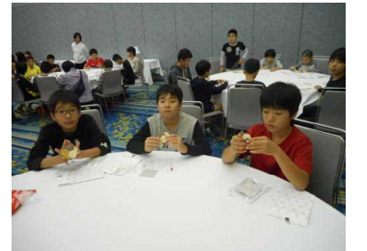
ホテルでは、寄木細工づくりにも挑戦しました。