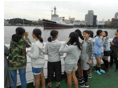
横浜では港内めぐりの遊覧船にも乗りました。