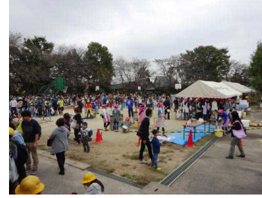
桜っ子まつりは大盛況。模擬店前には長蛇の列ができました。